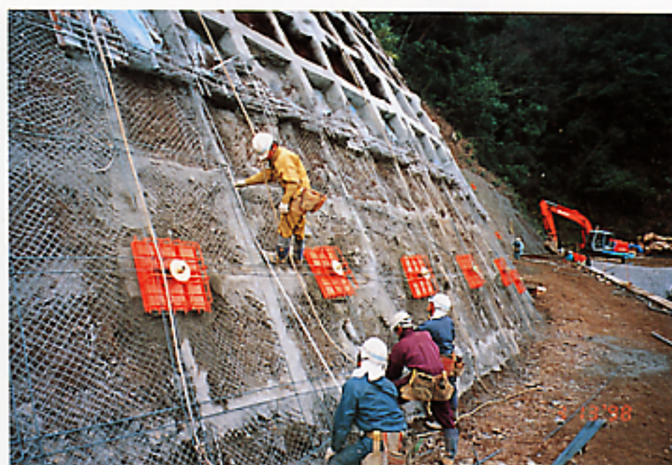
写真-2 1次支圧板実施例